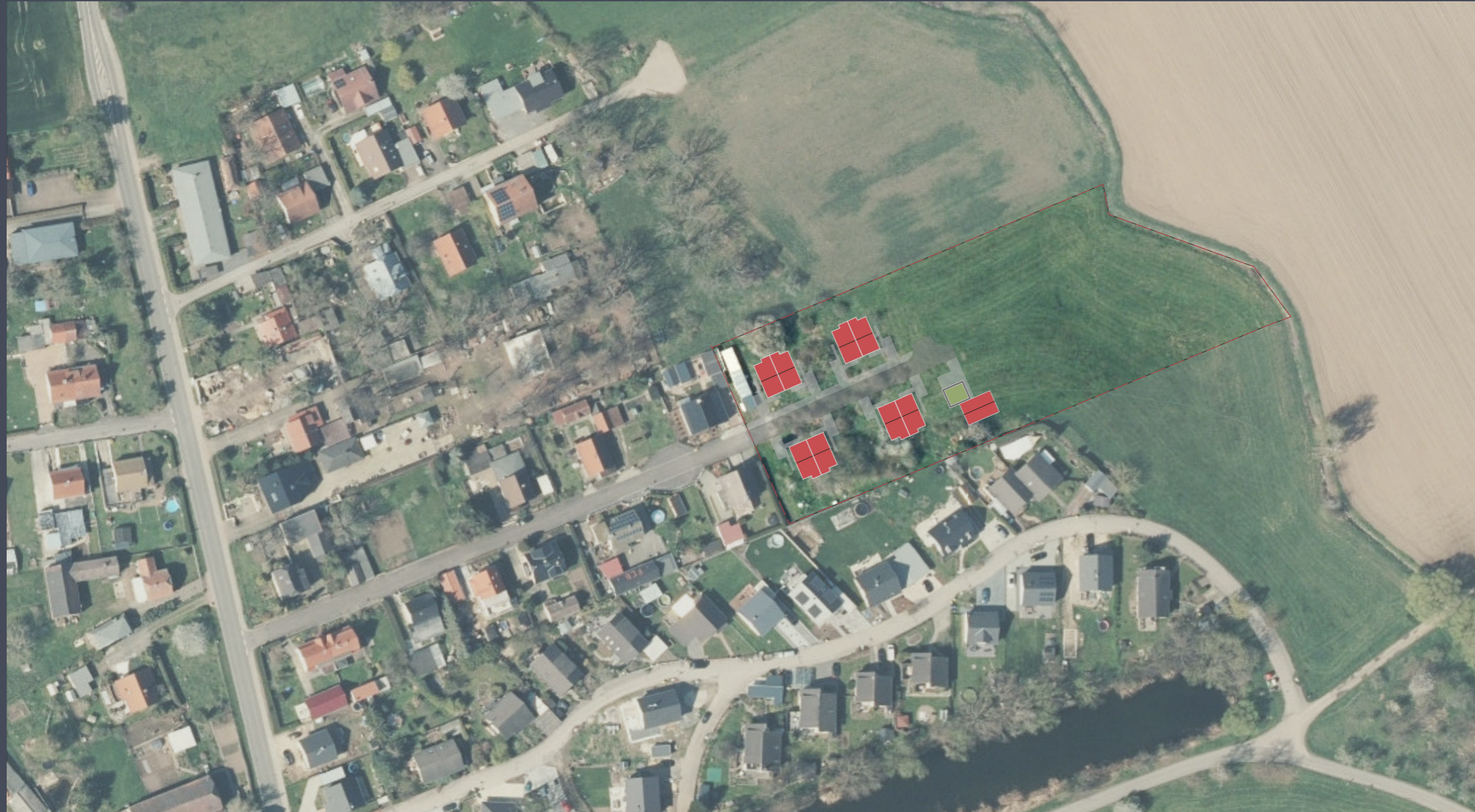
Flächenstudie Bebauung Altsiedlung 15, 04523 Pegau, OT Wiederau