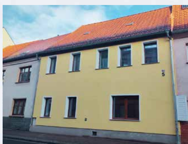
mit sanierter Außenfassade