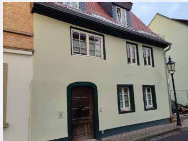
mit sanierter Außenfassade