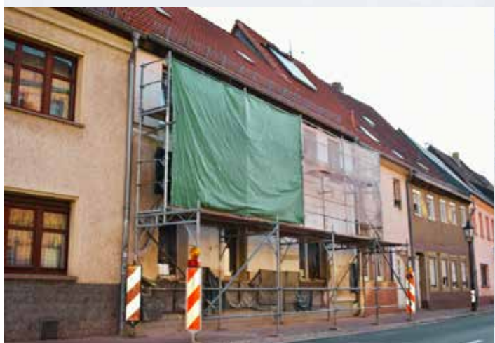
Leipziger Straße 5