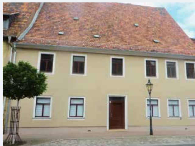
mit sanierter Außenfassade